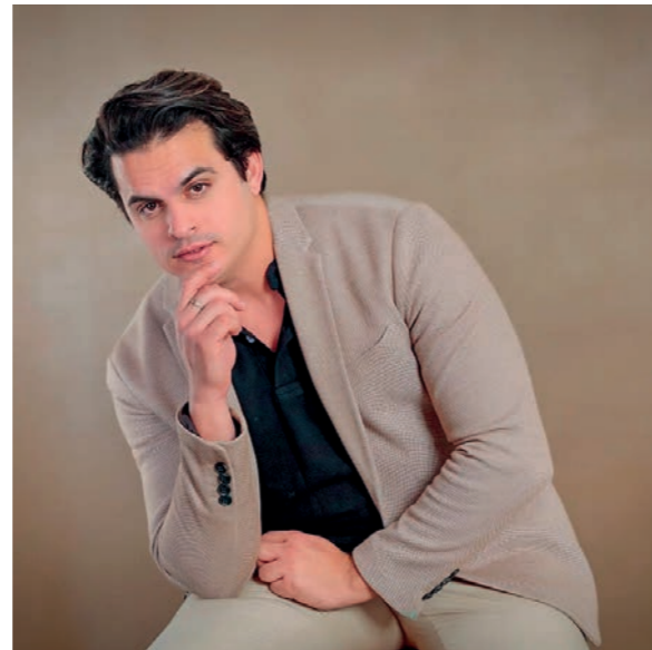
d'amore, La bohème, Gianni Schicchi, Pagliacci, Carmen o Faust entre otras.

Recientemente ha debutado en Carmina Burana de Carl Orff con la prestigiosa Ulster Orchestra en Irlanda del Norte. Su repertorio incluye los barítonos principales de óperas como Le nozze di Figaro , Così fan tutte , Don Giovanni , L'elisir